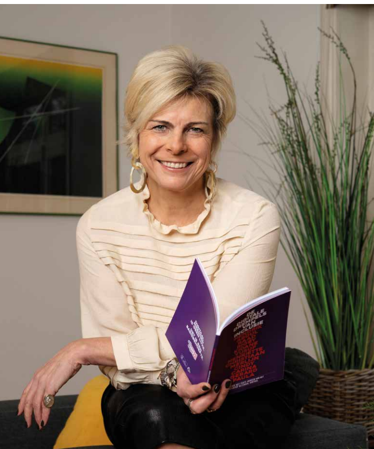
Prinses Laurentien: 'Taal legt de basis van zelfvertrouwen.'

In Nederland komen steeds meer kinderen met een taalachterstand de basisschool binnen. Laurentien noemt dit een 'sluimerende ramp', omdat het tekort aan basis(taal)vaardigheden een barrière is om later zelfstandig en succesvol mee te doen in onze complexe maatschappij, ook online. Dat heeft niet alleen negatieve gevolgen voor het individu en het gezin op het gebied van bijvoorbeeld gezondheid, sociale relaties en financiële zelfredzaamheid, maar ook voor de maatschappij als geheel.